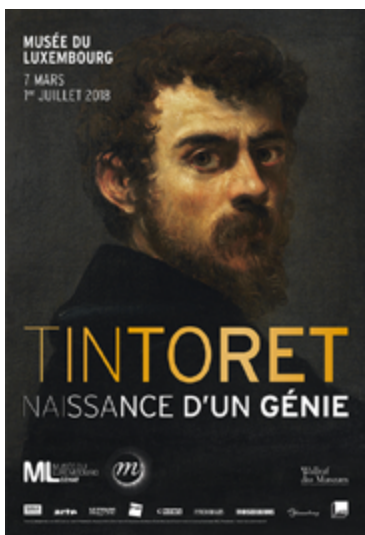
image du Prado